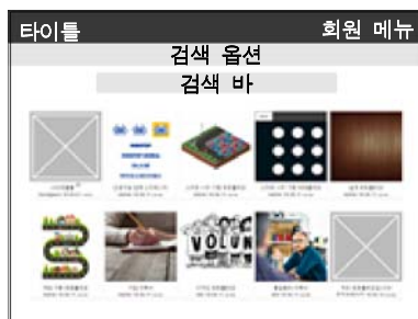
Fig. 2. Main page of the proposed online e-portfolio sharing model

제안하고자 하는 E-포트폴리오 공유 모델은 XE엔진 환경을 이용하여 개발 및 설치하였다. 모델의 메인 페이지는 Fig. 1과 같이 제안하고자 한다.